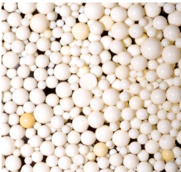
HumiSorb в исходном состоянии

Органические соединения удаляются по механизму электростатического гидрофобного взаимодействия.