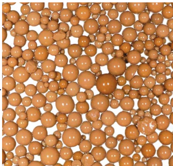
HumiSorb после сорбции органических соединений